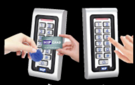
รองรับทั้งบัตร คีย์แท็ก และรหัส

ขอสงวนสิทธิ์ในการเปลี่ยนแปลงรายละเอียดทั้งหมดโดยไม่ต้องแจ้งให้ทราบล่วงหน้าโดย บริษัท เอช ไอ พี โกลบอล จำกัด.