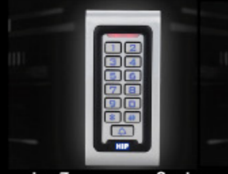
ปุ่มมีไฟแสดงผลในที่มืด