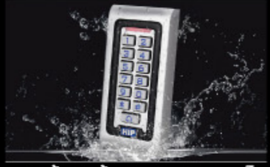
กันน้ำติดตั้งภายนอกอาคารได้